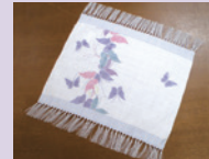
小千谷織物 小千谷紬 テーブルセンター 3名様