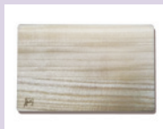
加茂桐箆笥 桐まな板 5名様