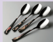
三条仏壇 蒔絵スプーン 3名様