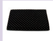
塩沢織物 ティッシュケース 10名様