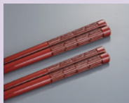
村上木彫堆朱 雷文夫婦箸 5名様