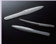
越後三条打刃物 積層材の ペーパーナイフ 3名様