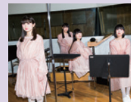
RYUTist サイン入りグッズ 3名様