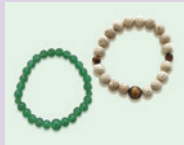
新潟・白根仏壇 ブレスレット 5名様