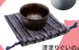
漆塗りぐいのみ 8,800 円