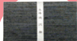
塩沢織物 札入れ 4,840 円