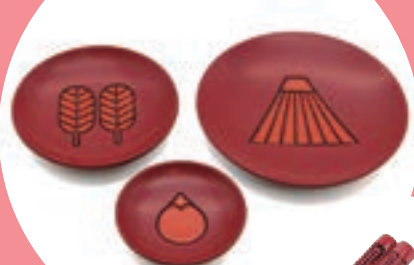
村上木彫堆朱 祝豆皿 3 枚セット 19,800 円