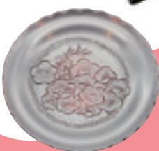
小品皿 7,150 円