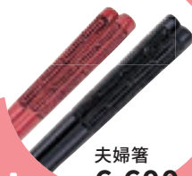
夫婦箸 6,600 円